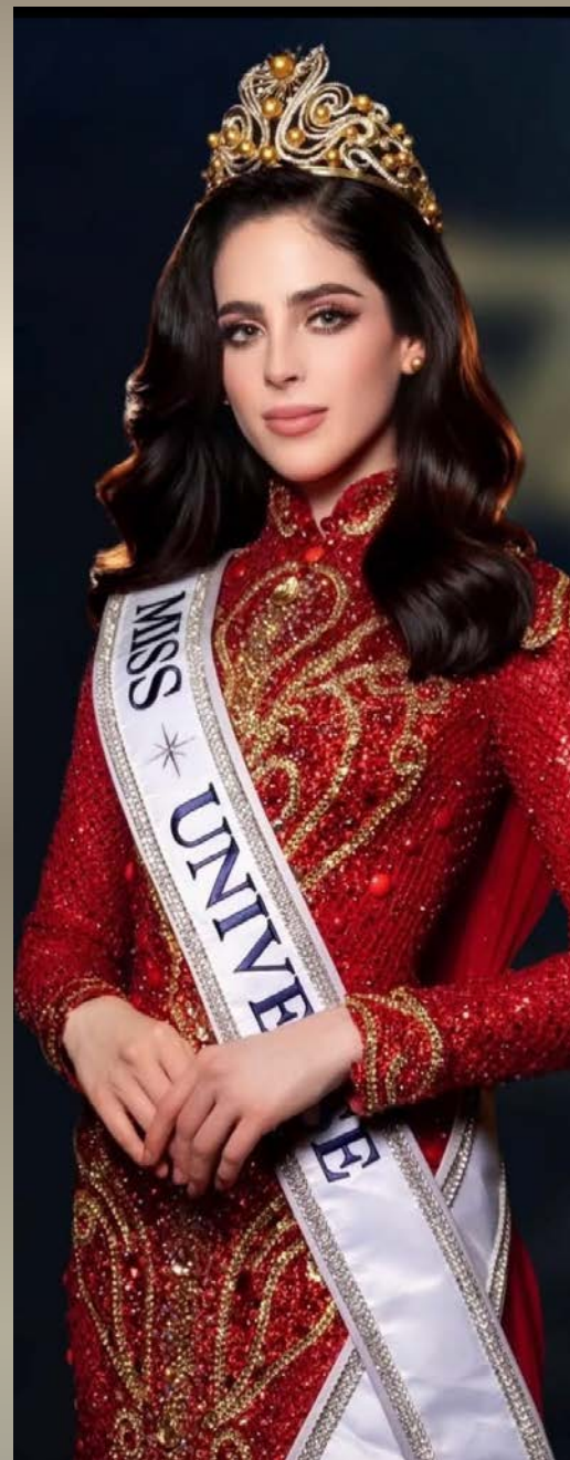
Fatima Bosch Miss Universe 2025

Exclusif : Droits complets d'utiliser l'image de Miss Universe Germany pendant un an dans toute votre publicité .